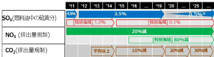
国際的な船舶からの排出ガス規制

我が国は、 世界最大のLNG輸入国 であり、 既存のLNG基地が多数立地 していることから、シンガポールと連携しつつ、 我が国においてLNGバンカリング拠点の形成を図る 。具体的には、LNGバンカリングに関する国際連携方策の検討等を行う。これにより、国際海上輸送分野における新たな市場を開拓するとともに、 我が国港湾へのコンテナ航路の寄港増 を図る。