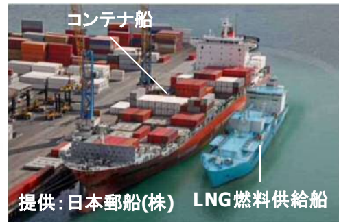
LNG燃料供給船