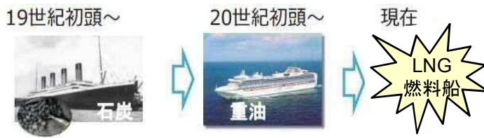
船舶用燃料の石炭から重油以来の大転換

(※早ければ2020年より、一般海域においてもSO x (硫酸酸化物)の規制強化が開始予定)