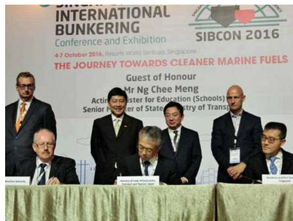
署名の様子（中央：菊地港湾局長）